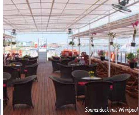
Sonnendeck mit Whirlpool